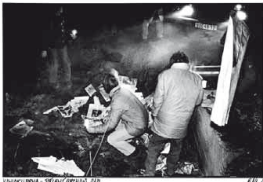
KAPITOLU BRNA - PŘELAMÁ ARCHIVU 478