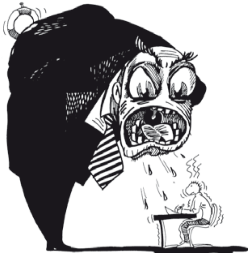
Kresba Aleš Čuma

možnost vzdělávat se, učit se kriticky myslet, vyhledávat problémy a pracovat na jejich řešení je v těsném závěsu za rozhodující prioritou – a tou je propustnost studijního programu u bakalářských a magisterských zkoušek. Univerzita se mění v uličku, kterou je třeba projít pokud možno bez zábran: a to v obojí slova smyslu. Z profesorů se stávají pomocníci, jejichž čestnou povinností je případně strážně studia minimalizovat.“ (Břetislav Horyna: In unum vertere? Univerzita dnes. Aluze 2/2008) Páně profesorovo vnitřní trauma se projevuje v jedovaté zlobě, jež ukapává během přednášek („Tak co, vy zoufalci...“) a ze zkoušek dělá martyrium a účinné, avšak nevy-