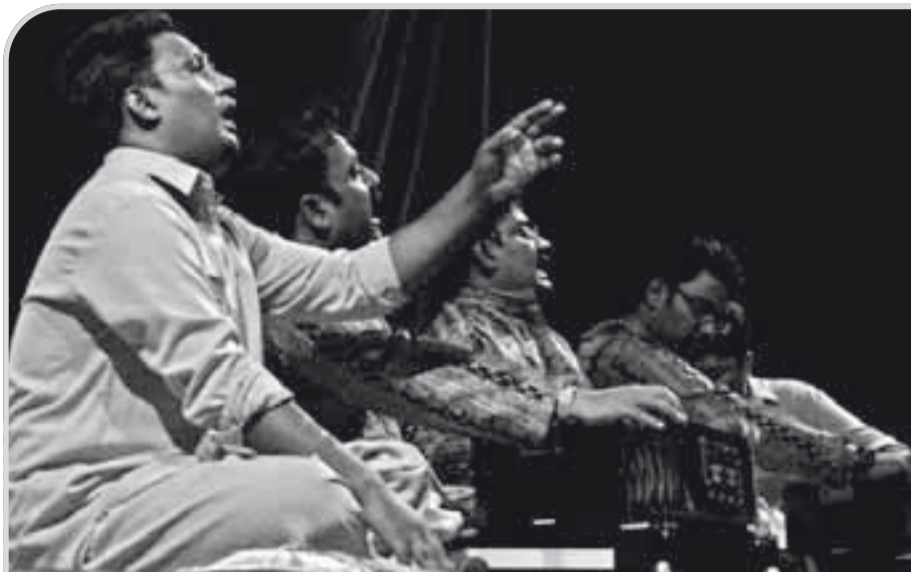
Zpěvy qawwali.

I když panorama české kultury se za posledních dvacet let změnilo víc než dramaticky, bludy naočkované komunistickou minulostí mizejí pomalu. Ohlédněme se, jak probíhalo naše otevírání se světu v hudební sféře.