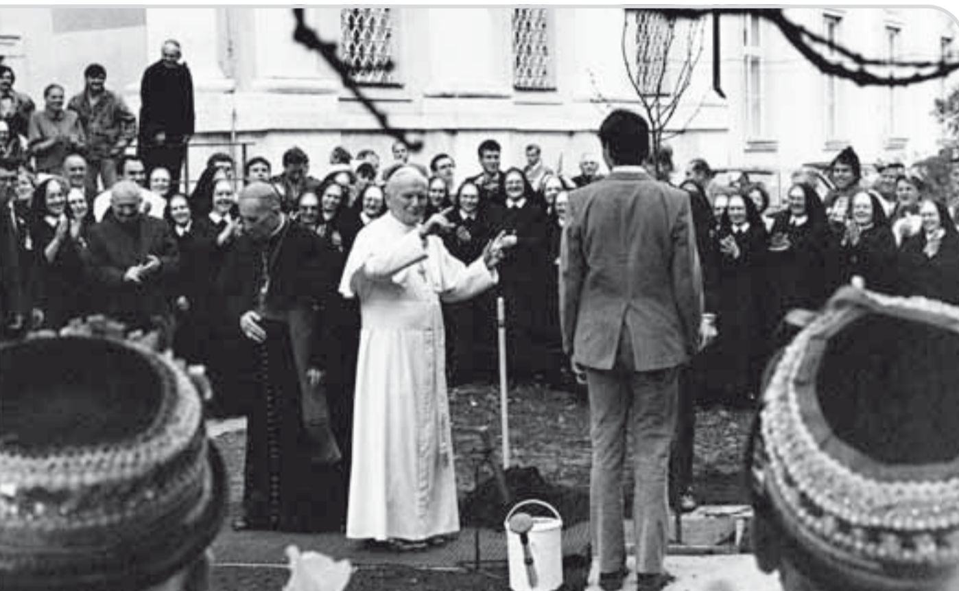
Jan Pavel II. na Velehradě 22. dubna 1990.

V nových poměrech náboženský boom nenastal. V prvním svobodném školním roce přihlásili rodiče k výuce náboženství překvapivě velké množství dětí. Již v průběhu tohoto roku děti z nepovinné výuky hromadně prchaly. V dalším roce už počet přihlášených byl přibližně stejný jako za komunistického režimu. Teologické fakulty se vrátily do svazku univerzit a naplnily se studenty, jejich počet však v následujících letech prudce klesal a už řadu let absolventi nevyrovňávají přirozený úbytek duchovních. Římskokatolická církev udržuje chod stovek farností jen díky kněžím vypůjčeným z Polska. Mužské kláštery se rychle naplnily dotud utajenými členy a novici. Po pár letech opět, až na vzácné výjimky, zejí prázdnotou. Za první desetiletí mezi sčítáními lidu raketově vzrostl počet lidí bez vyznání ze zaokrouhlené 40 na 60 procent. Není třeba žádné oficiální protináboženské propagandy, náboženská společenství prostě ztrácejí důvěru a lidé se k nim méně hlásí a méně se podílejí na jejich aktivitách.