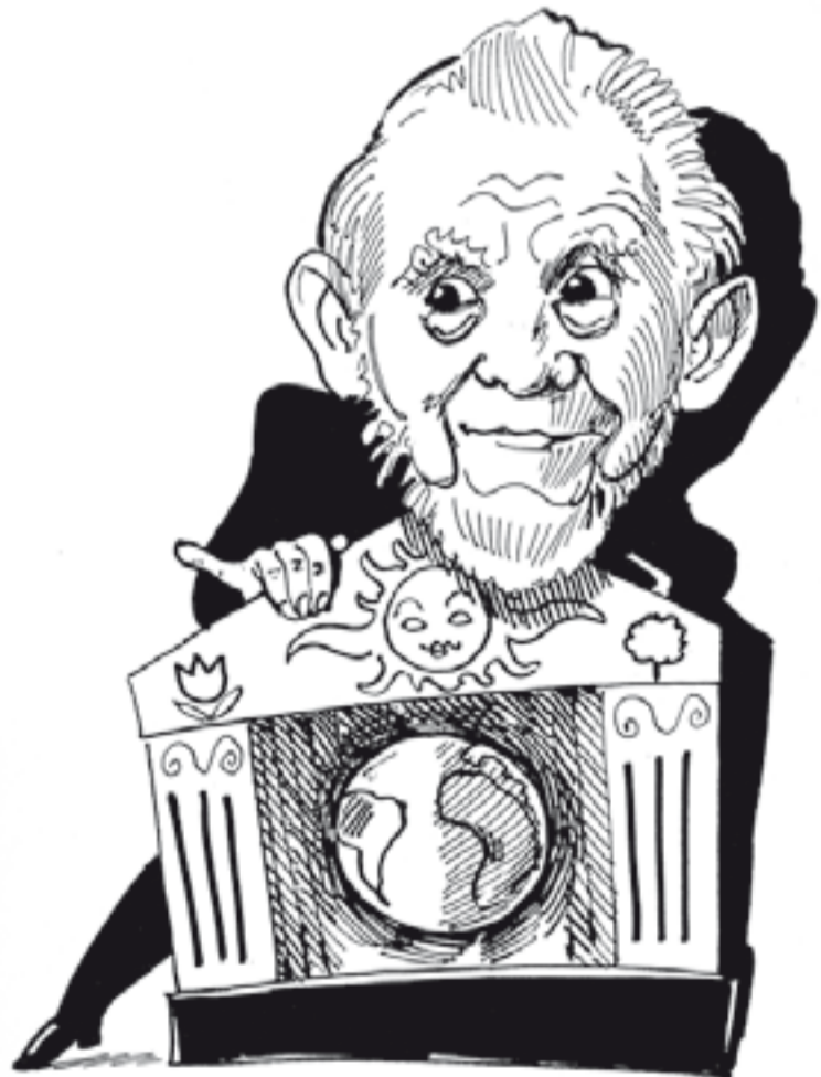
Kresba Aleš Čuma

Erazim Kohák: Domov a dálava Kulturní totožnost a obecné lidství v českém myšlení Filosofie, nakladatelství Filosofického ústavu AV ČR, Praha 2009