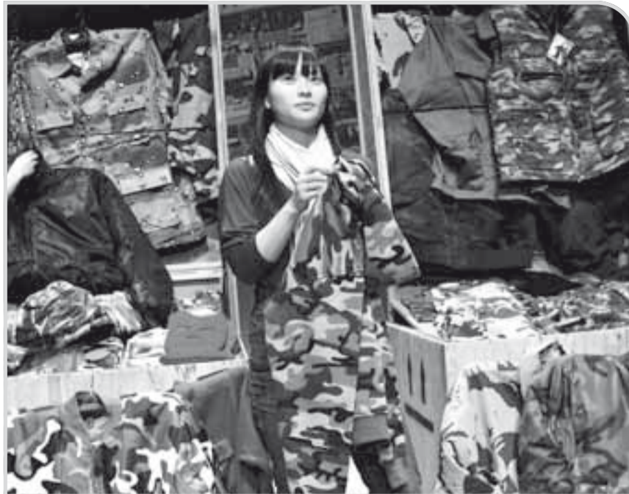
Kdo by si chtěl s vietnamskými trhovci vyměnit místo?

Na inscenaci Vùng biền gió je mnoho pozoruhodného. Je to především schopnost Rimini Protokollu jemně strukturovat jevištní tvar jako pozvolnou, nedramatickou a intimní revue, v rámci níž se promluvy střídají s písněmi (třeba s těmi vojenskými), projekcemi, jemnými změnami dekorací nebo anketami, kdy se aktéři v odpověď na rozmanité otázky občas seřadí do zástupu, jako třeba: „Kdo viděl padat nejvíce bomb?“, „Kdo zde žije nejdéle?“ a podobně. Pozoruhodnou je také nezjevná metoda, jakou se