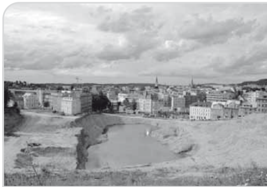
Když nemůže obchodní centrum na horu, musí hora pryč.

Liberec, jako vzorové město devastace veřejného prostoru.