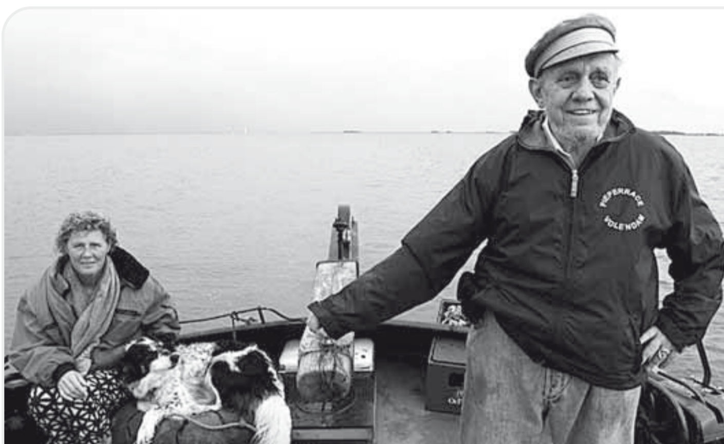
Ideální plavba: s filosofem u kormidla.

D R U Ž S T E V N Í L I S T P R O P O L I T I K U , S P O L E Č N O S T , V Ě D U A U M Ě N Í