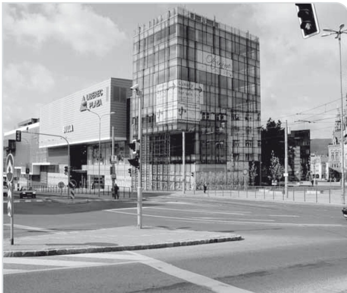
Plaza místo parku. Past(va) pro oči.

Autor je teoretik umění a kurátor výstav.