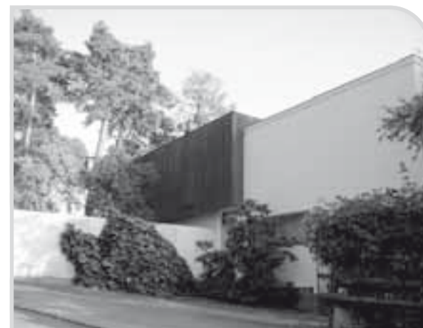
Osud rodinného domu Alvara Aalta v Helsinkách by mohl být v mnohém inspirativní pro stát a město Brno v tom, jak naložit s vilou Tugendhat.

Velikost či tíha průvodce není při víkendové procházce na obtíž. Kniha je opatřena měkkou odolnější vyztuženou vazbou a obsahuje mapu, která důsledně zabírá jen administrativní část města Helsinek. Každé z Aaltových staveb se Leena