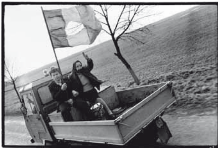
Rumunsko, prosinec 1989

měli strach. Z mnoha osob nás zůstalo jen pět lidí v Temešváru. Rumuni nás ubytovali v nejlepším svém hotelu společně se západními novináři. Byly s námi dvě studentky medicíny, chtěly pomáhat ošetřovat raněné. Večer se ještě porozhlédly v místní nemocnici. Situace zoufalá. Skoro žádné vybavení a žádný zdravotnický materiál, špína, švábi a k tomu zima. Holčák se podařilo vrátit do hotelu, i když v nemocnici říkali, že noční cesta městem je velmi nebezpečná. V ulicích byla tma. Ráno nás budí střelba. Na druhém konci náměstí mají Securitate obsazený dům a střílí po lidech. Hodně lidí běží proti odstřelovačům pouze s holemi a tyčemi. Studentky medicíny vstoupily na balkón. Ještě jsem se oblékal a chystal foťák. Ale během několika vteřin začaly kulky létat těsně kolem hlav našich studentek. Okamžitě padly k zemi, jedna z nich však dostala zásah do nohy. Podařilo se jim vyplazit z balkónu do pokoje. Hned začali přibíhat západní novináři a reportéři, aby si mohli nafotit a nafilmovat prostřelenou nohu. Přišlo jich snad třicet. Každého reportéra se holky ptaly,