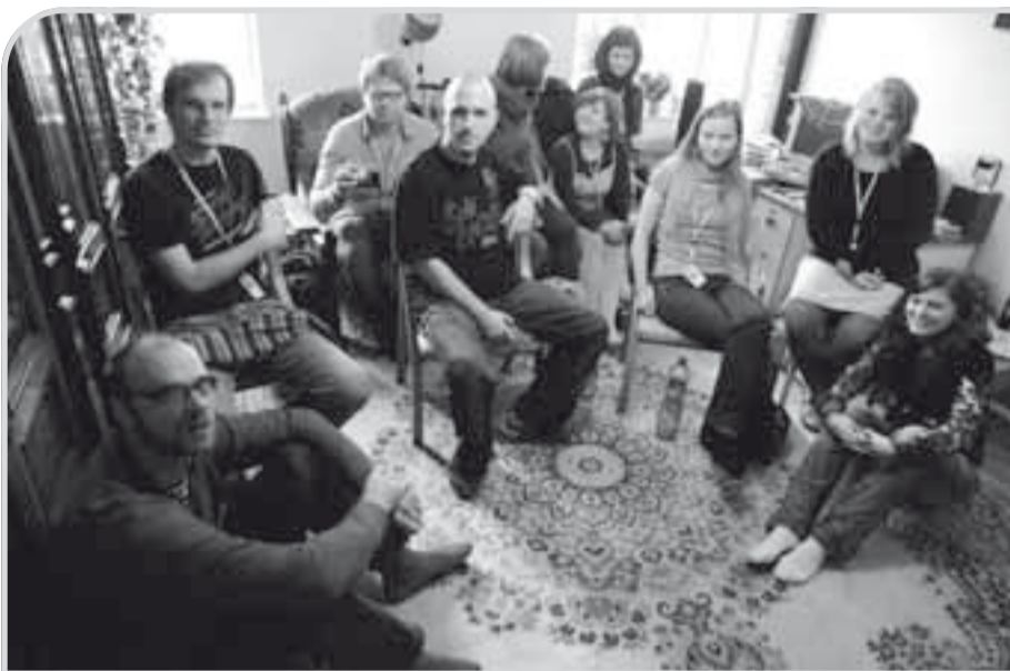
Festival přenesl projekce také do jihlavských domácností.

předvídat už od samotného zárodku. Dobré dílo v druhé perspektivě představuje především riziko. Chceme-li jej popsat v několika větách, docházíme jen k banalitám, které mají v lepším případě podobu vzletných formulací. Potřebuje čas, aby mohlo být vnímáno, a pár vět nevystihne jeho podstatu. Jihlavský festival je oproti stovkám jiných, které sestavují svůj dramaturgický plán ve stejném poli, unikátní tím, že se mu to dlouhodobě daří. Podobně jako už čím dál více jiných festivalů rezignoval také na statutární původ filmů. V soutěžích vidíme i skvělé de iure studentské filmy. Tvůrci – před FAMU už často absolventi jiných škol – věnují jejich zrání časem mnohonásobně víc energie a času, než se děje u tzv. profesionálních projektů. Šípův Soubor s mozkem, který získal čestné uznání, otevírá surový a současně vznešený