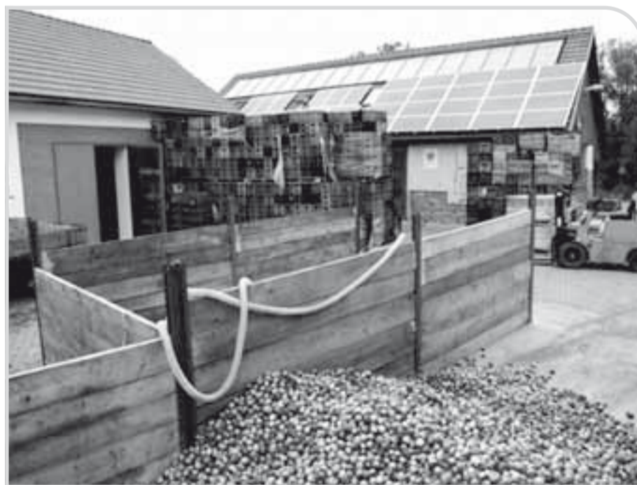
Moštárna v Hostětíně.

V roce 2006 byl na pozemku Nadace Veronica postaven první pasivní dům v České republice. Ten má až desetkrát nižší spotřebu energie než staré domy, využívá zapomenutou technologii sběru a využití dešťové vody a je izolován pomocí místních zdrojů.