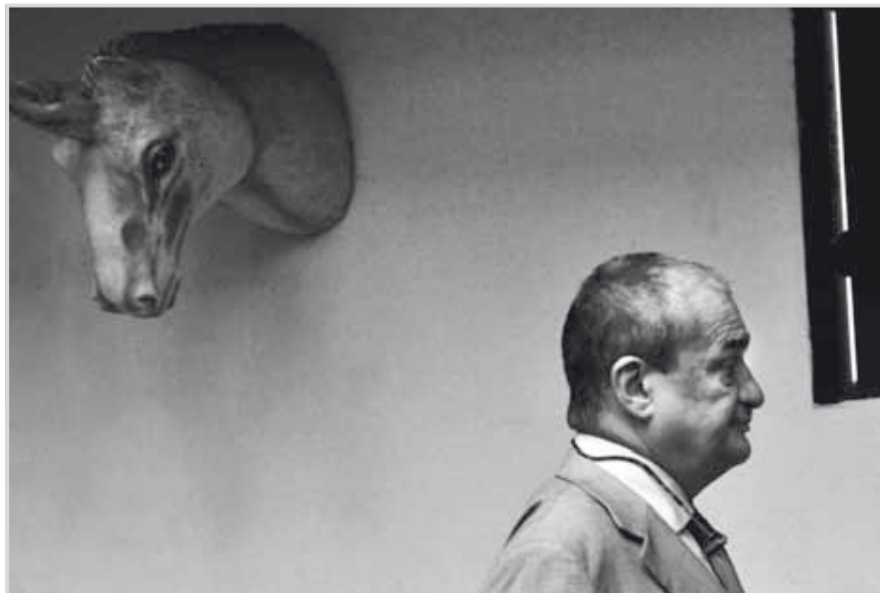
Quo vadis, tetrarches?

Autor je komentátorem Deníku a bývalým komentátorem Radiožurnálu.