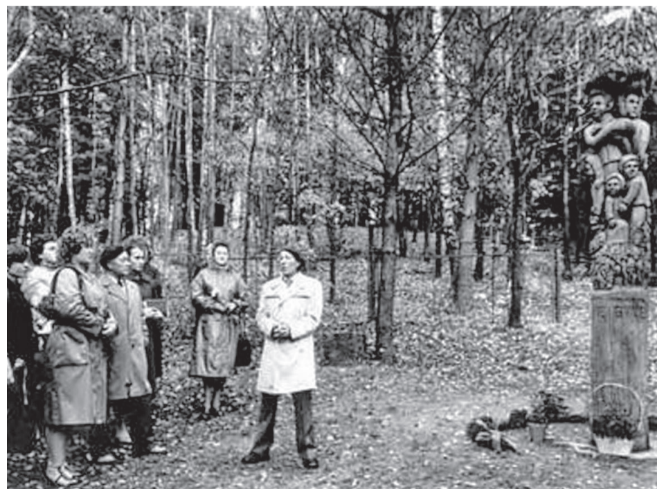
Dva výjevy z dějin litevských Židů: příchod okupantů do Kaunasu 1941 a odhalení pomníku obětí holocaustu v roce 1989.