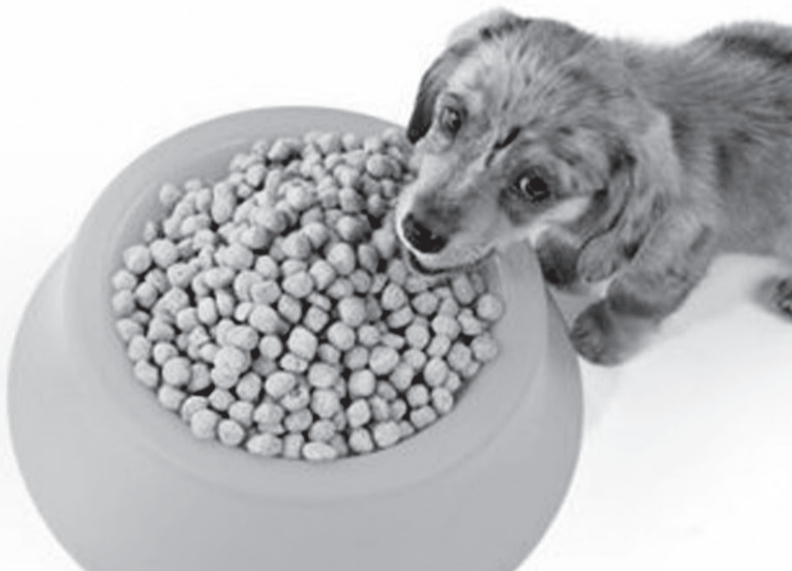
Aby byla nabídka čteny pro lidi alespoň tak pestrá jako žrádla pro psy.

Václav Umlauf (1960) je filosof, teolog, katolický kněz, jezuita a provozovatel portálu www.umlaufoviny.com .