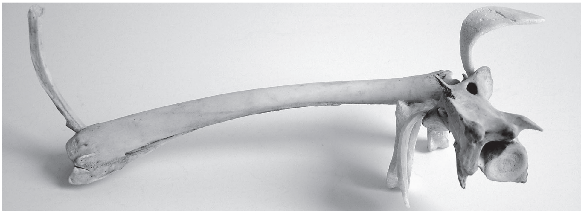
Pes Lapák, 2011, 24 cm, foto archiv autora