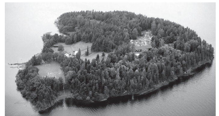
Idyllický ostrov Utøya se stal neblahým symbolem.