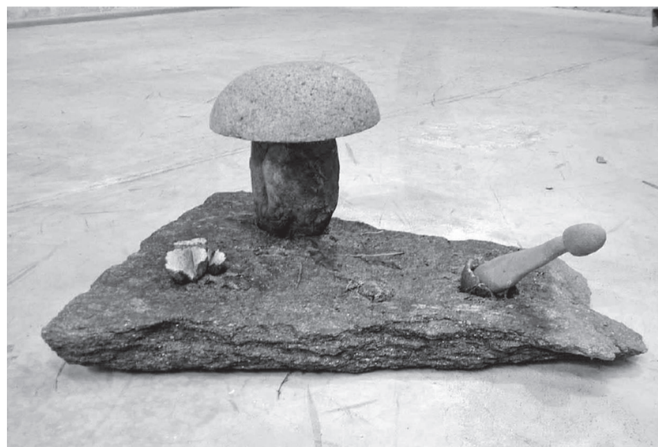
Prahuby 4, 2008, 64 × 55 × 30 cm