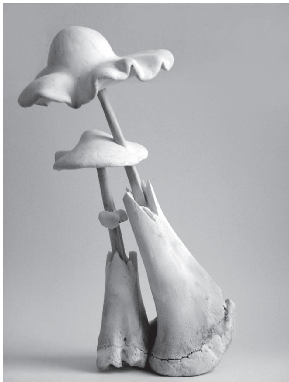
Smrtka-dvojka, 41 cm, kombinovaná technika, 2011