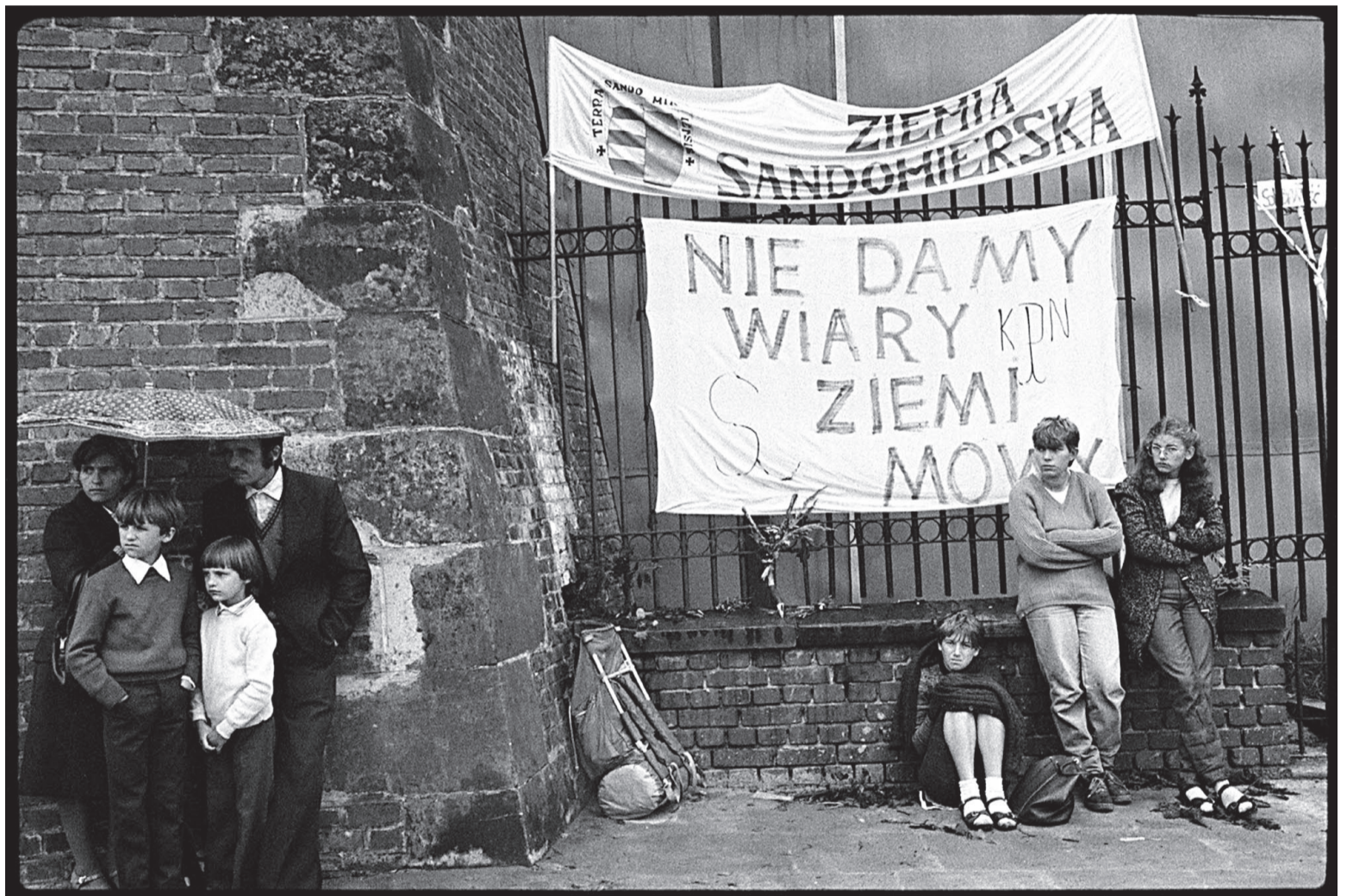
„Nedáme víru, zemi, řeč – KPN“ (KPN – Konfederace nezávislého Polska, podzemní organizace). Transparent v roce 1983 na Jasné Hoře na celostátní mariánské pouti do Čenstochové.

Letošní oslavy Dne nezávislosti naznačily, že v polské veřejnosti se dávají do pohybu nezanedbatelné síly, které evokují pnutí 80. let. Jsou vyvolány rostoucími sociálními problémy a obavami ze ztráty polské suverenity v rámci Evropské unie. Na straně 4 přinášíme dva pohledy na rozjitřenou situaci kolem Pochodu nezávislosti.